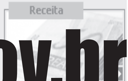
Crescimento Bruto de IDH