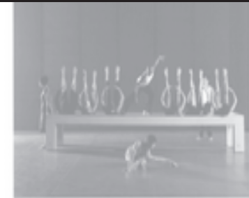
Cia de dança Deborah Colker se apresenta em Barra do Piraí